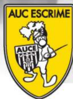
Tableau final à partir de 15h

Complexe du Val de l'Arc - Aix-en-Provence